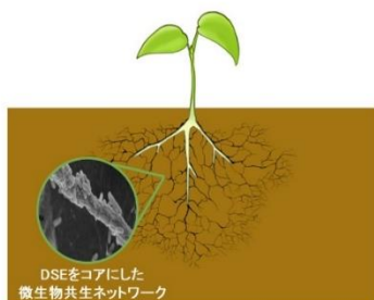
植物-DSE-土着微生物の共生系