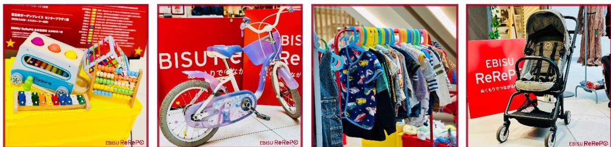
サービスイメージ

今回の実証実験を通じて、「『ひと』や『まち』への貢献のために行動する方々」との繋がりを深め、よりエコでスマートで心地よいコミュニティを形成しながら、サービスの更なる改善点を抽出し、今後の事業展開を目指します。