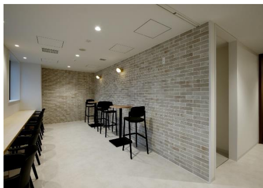
3階リフレッシュコーナー